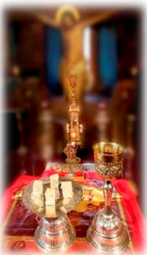
Sf. Proscomidie Jertfa lui Hristos

"Pe cei ce au adus aceste Cinstite Daruri și pentru cei ce s-au adus, vii și adormiți, să-l pomenească Domnul Dumnezeu întru Împărăția Sa."